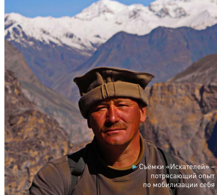
▶ Съёмки «Искателей» – потрясающий опыт по мобилизации себя

Я чётко понимал тогда: если не стану известным режиссёром, зачем учился профессии? Да, ситуация в кино патовая. Ну, значит, надо ещё больше включать выдумку! На первый свой фильм деньги я нашёл удивительно просто. Пришёл в банк и на голубом глазу заявил: «Дайте деньги на кино». Видимо, банк уже загибался и им нужно было куда-то списать энное количество тугриков, поэтому мне дали буквально тут же и без всяких расписок! Это был первый шаг. Дальше, нужно было придумать кино, от которого у всех снесёт башку. То есть если делать ужастик, то такой, чтобы в зале во время просмотра людей тошнило. Идея фильма была бредовой. Но именно так и надо было поступать в те 90-е годы. И я своего добился: человека два-три на «Конструкторе красного цвета» реально стошнило. Эффект стоил того: я сразу стал известным, фильм показали на Московском фестивале наравне с фильмами мэтров мирового уровня. Я тогда ко всему прочему ещё и сознательно выстраивал свой имидж: ходил в псевдовоенных мундирах – эполеты, галифе, лампасы... Эпатировал! Ради чего? Да чтобы на улице каждая собака узнавала! Эпатаж как приём действовал тогда безотказно. При этом я прекрасно понимал: эпатаж – это часть игры, но это и клеймо. А клеймо нужно переплавить в визитную карточку новатора. Сделав суперпроект – дорогой, с хорошими, популярными актёрами и внятным сюжетом.